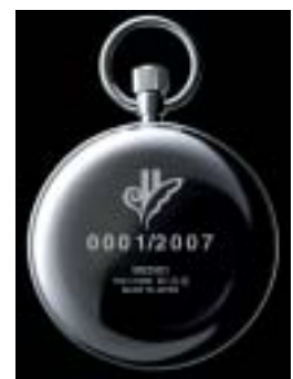
裏蓋 シリアルNo.入りデザイン

この商品に関するお問い合わせ先 阪急梅田駅テレホンセンター 06-6373-5290(8:30~19:45)