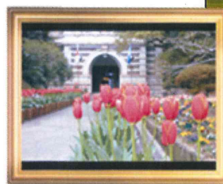
例) 木製イメージのフレーム

お客様が阪急沿線で撮影した写真は、パソコンやスマートフォン(*1)から簡単に投稿でき、木製やアルミ製などのイメージのお好きな写真フレーム(額)を付けることで、写真の雰囲気に合わせて飾り付けすることもできます。