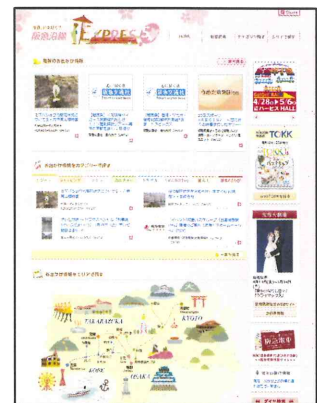
トップページ画面

阪急沿線に関する最新情報を集めたニュースポータルサイトとして、一般公募のお客様ブロガーに沿線情報を発信していただく「ブログ de バーチャル駅長」、株式会社ぐるなびとの共同運営沿線レストラン情報コーナー「阪急ぐるなび沿線レストランガイド」や、阪急沿線で展開する阪急阪神グループの施設・サービスの最新情報が満載の WEB サイトです。パソコンだけでなく、スマートフォンでの閲覧にも対応しています。