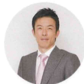
隊長 赤星憲広さん(元阪神タイガース選手)

※ 本イベントは、8月2日に開催する3つのプログラム（「阪急阪神 忘れ物再生工場」「みんなでチャレンジ！テーブルマナー」「自分だけのオルゴールの音色をつくろう！」）にご参加の方を招待するもので、本イベントのみの参加募集はいたしません。