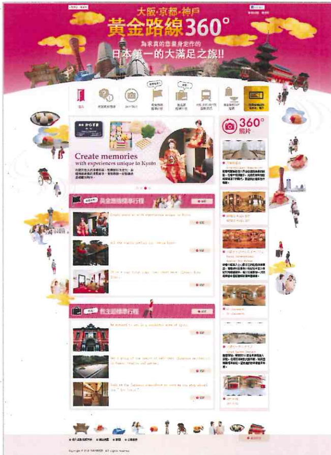
ウェブサイト・トップ画面

「大阪・京都・神戸 黄金路線360°」 関西訪問は初めてというビギナーから、 リピーターまで幅広くご満足いただけるよう ささまざまな観点で情報を掲載。 左の画面は、中国語(繁体字)版。