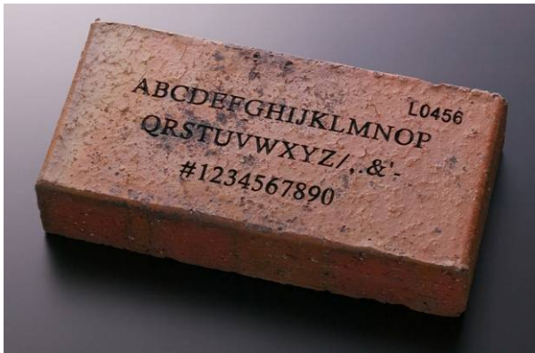
<刻印したレンガのイメージ>