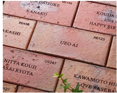
<床面に敷設したイメージ>